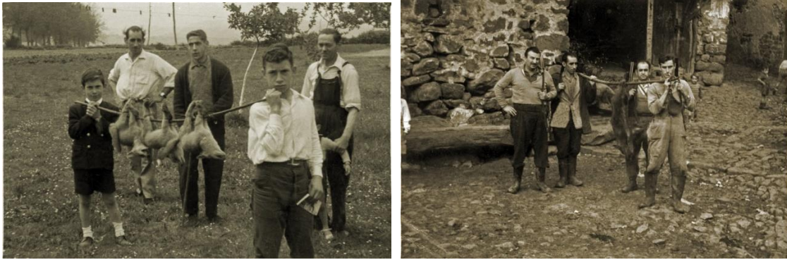
En Villapresente había excelentes cazadores de animales dañinos