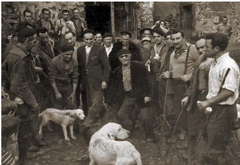
Cuadrilla de cazadores del Ayuntamiento de Reocín